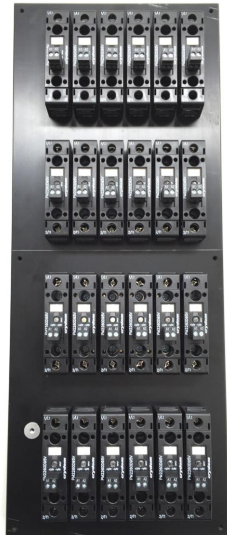
Abb. 2: 24 x 22,5 mm Baubreite