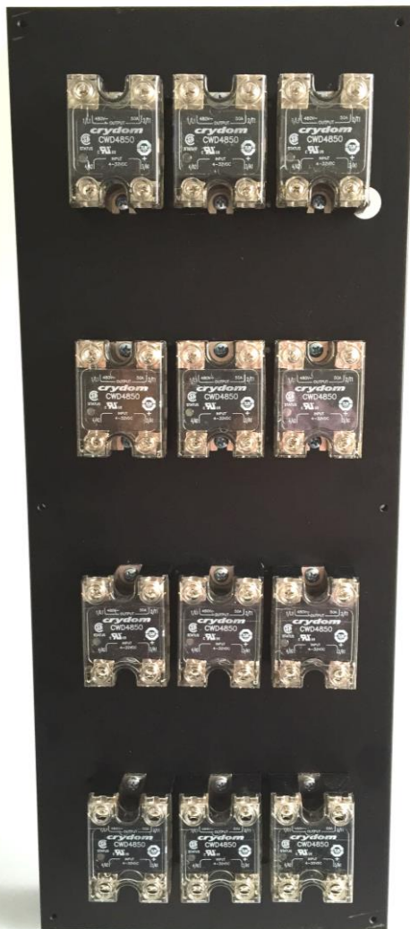
Abb. 1: 12 x 45,0 mm Baubreite

Auf Anfrage sind auch andere Konfigurationen möglich.